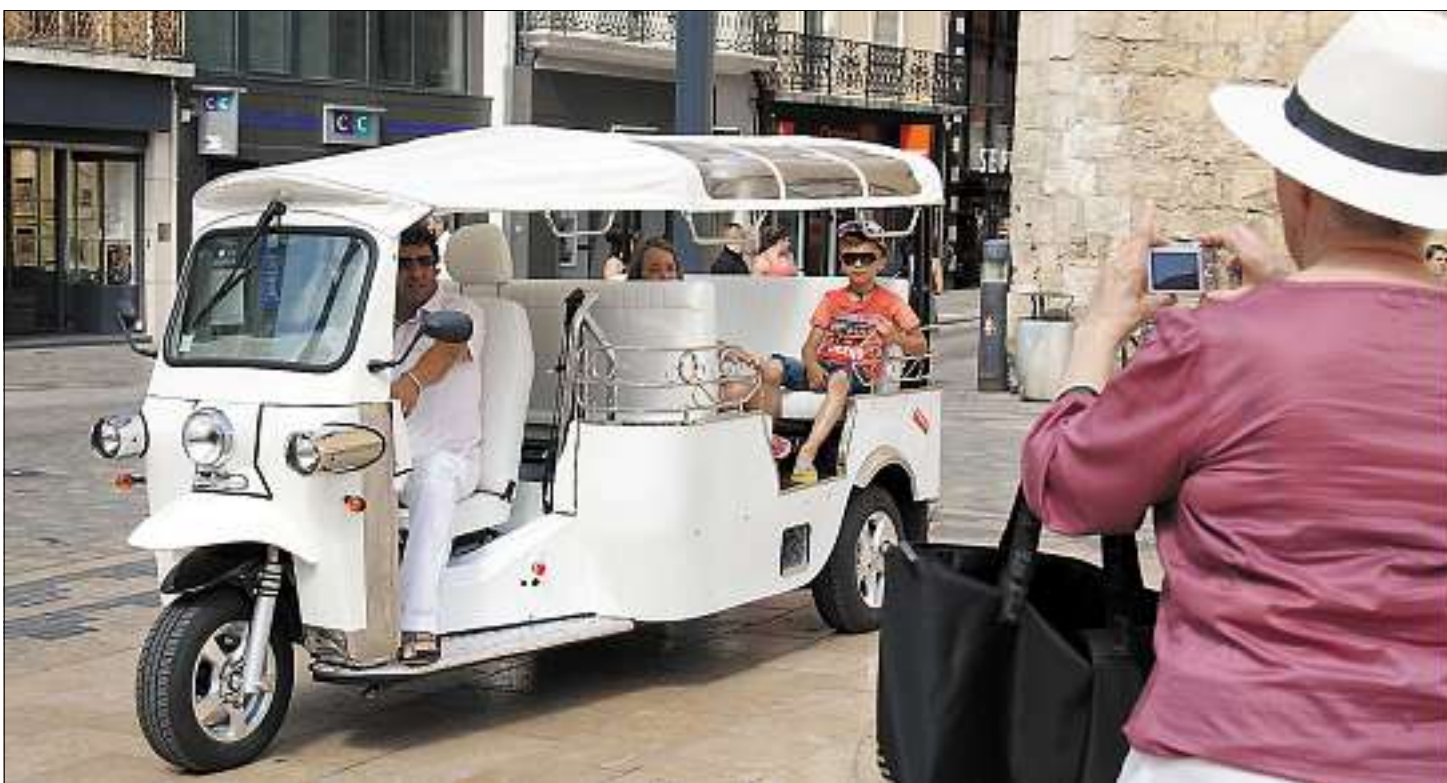
► Vacanciers et Narbonnais ont déjà adopté le tuk-tuk, ce drôle de taxi venu d'ailleurs.

Ce drôle de véhicule venu d'Asie parcourt les rues du cœur de ville.