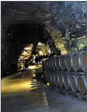
► Une visite souterraine autour du vin et de sa production.